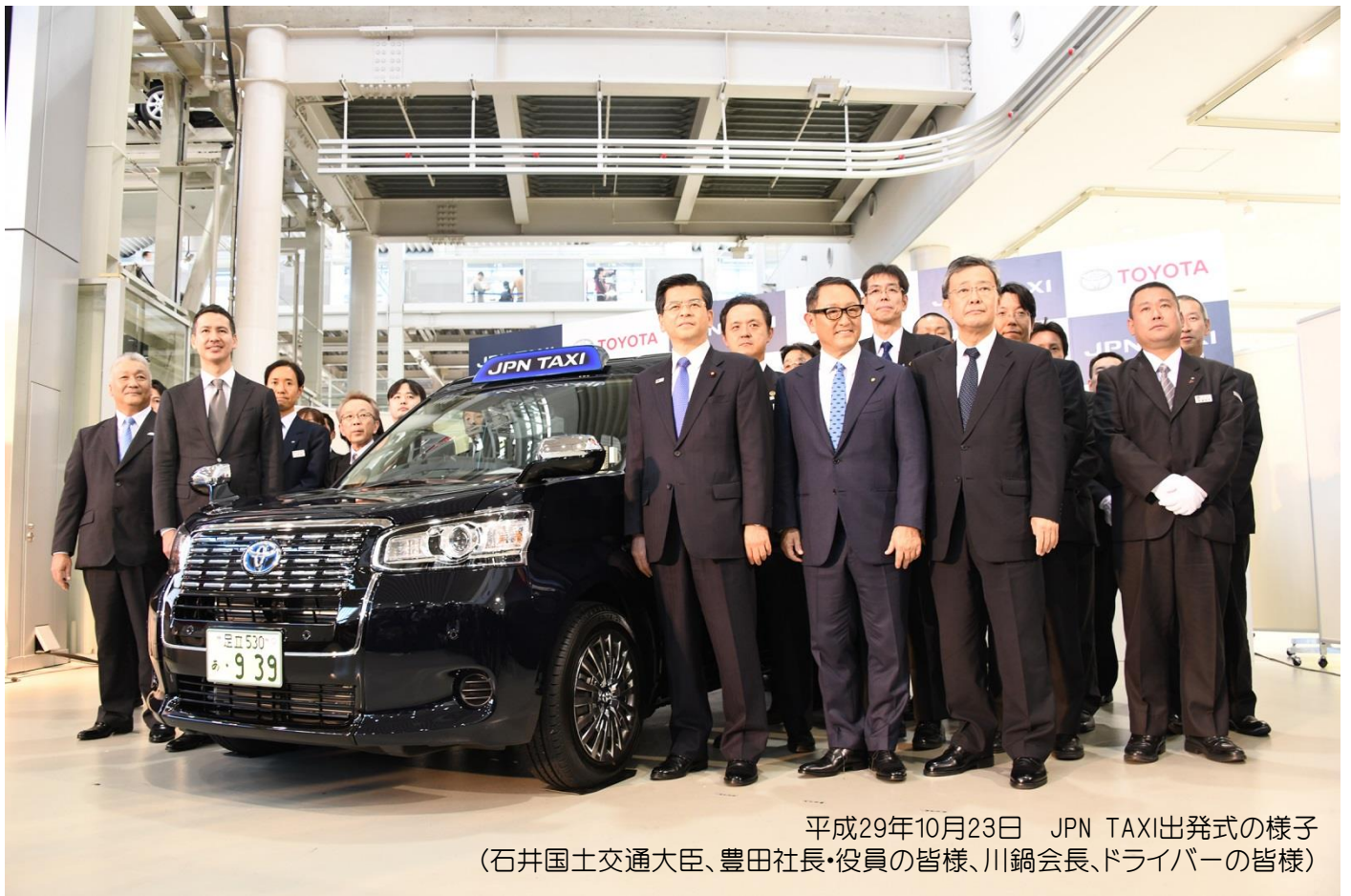
平成29年10月23日 JPN TAXI出発式の様子 (石井国土交通大臣、豊田社長・役員の皆様、川鍋会長、ドライバーの皆様)